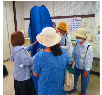
《簡易トイレ組立体験》